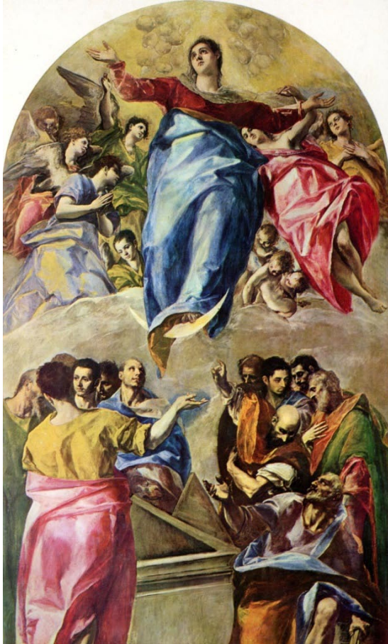
Le Greco. L'Assomption de la Vierge . 401x226 cm. Chicago, Art Institute.

On pourrait d'ailleurs faire ici un rapprochement avec des correspondances modernes, par exemple avec celles de cette toile sans titre due à De Kooning.