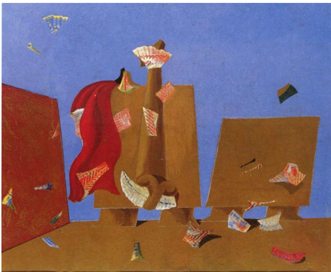
Max Ernst. Les papillons . 55x65 cm. Waddington Galleries, Londres.

L'autre est un Max Ernst : « Les papillons ».