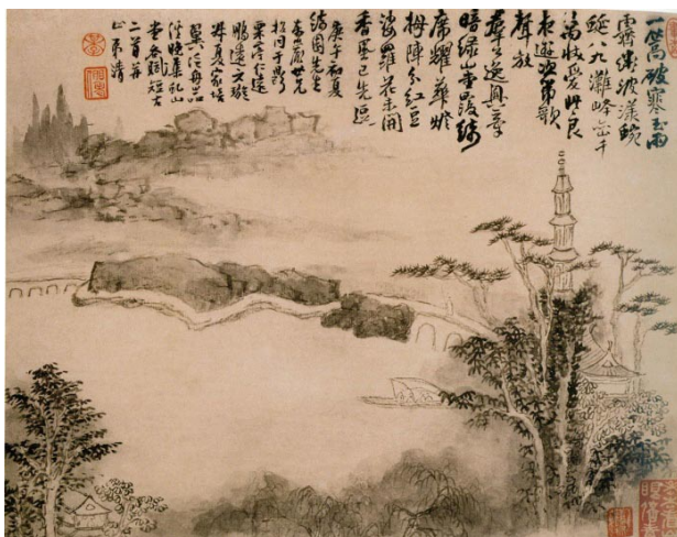
Mei Qing. Feuille extraite de l'album des scènes du Huangshan, XVIIe siècle . 22,7x44,3 cm. Musée de la Cité interdite, Pékin.

Le voile peut être un vide clair qui interrompt ou simplement juxte l'identifiable. Le procédé est particulièrement répandu dans la peinture chinoise où il est souvent dû à des effets de brume. Tel est le cas dans cette œuvre du dix septième siècle (de Mei Qing).