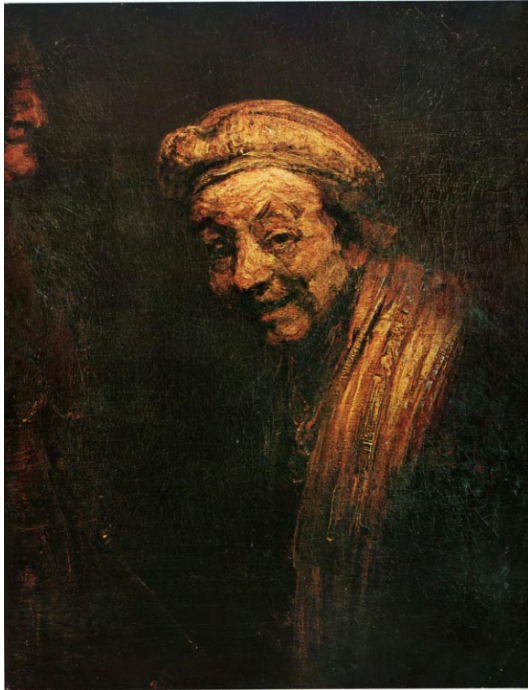
Rembrandt. Portrait de l'artiste par lui-même . 82,5x65 cm. Wallraf-Richartz-Museum, Cologne.

Et chez Pierre Soulages, l'intérêt quasi exclusif pour le noir jouant avec du blanc ne tiendrait-il pas au pouvoir qu'a le plus obscur d'introduire un au-delà du visible ? D'ailleurs, le peintre ne nomme-t-il pas « outre-noir » son procédé qui, grâce à la brillance du noir fait apparaître des reflets et donc des contrastes de valeur ?