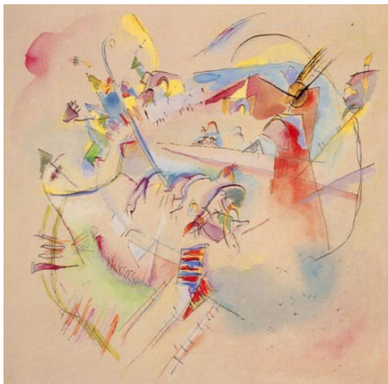
Kandinsky. Sans titre . 1981, 22x22,5 cm. Collection Nina Kandinsky

On retrouve quelque chose de ce type de structure, mais avec une manière très légère, dans ce Kandinsky sans titre.