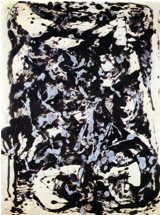
Jackson Pollock. Brun et argent . 145x101 cm. Museum of Modern Art Bulletin, New York.

Ne serait-ce pas ce qui donne une certaine présence aux « drippings » de Pollock ? Mais là, comme par exemple dans « Brun et argent », sans que rien ne puisse émerger de ce qui, peut-être, visite une profondeur subconsciente.