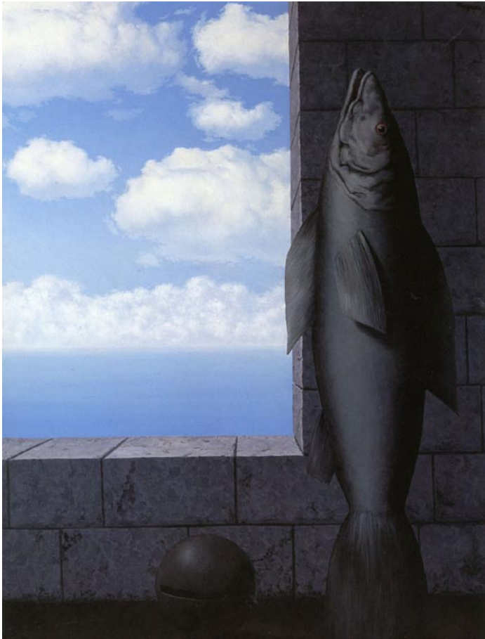
Magritte. La Recherche de la vérité . 130x97 cm. Musées Royaume des Beaux-Arts, Bruxelles

Voici deux autres exemples. L'un est pris chez Magritte, c'est « La Recherche de la vérité ».