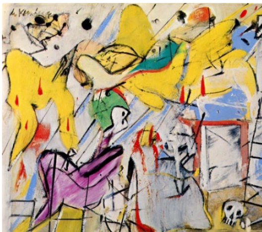
De Kooning. Sans titre . 46x37 cm. Collection Thvssen-Bornemisza.

On pourrait d'ailleurs faire ici un rapprochement avec des correspondances modernes, par exemple avec celles de cette toile sans titre due à De Kooning.