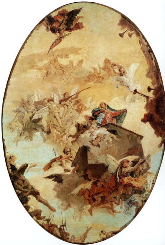
Giovanni Battista Tiepolo. Le Miracle de la sainte maison de Lorette . 124x85 cm. Gallerie dell'Accademia, Venise.

Parmi beaucoup d'autres types de correspondances, il y a celles qui unissent des enchevêtrements de lignes et de coloris légers, comme dans ce Tiepolo « Le Miracle de la sainte maison de Lorette ».