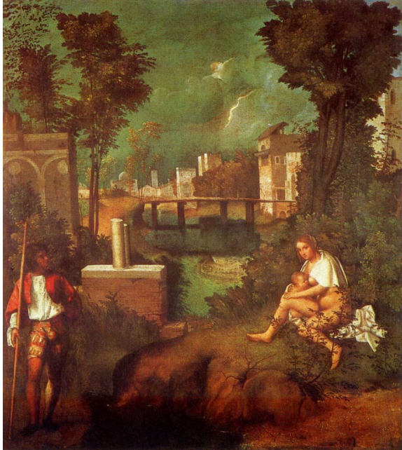
Giorgione. La Tempête . 82x73 cm. Gallerie dell'Accademia, Venise.

Il y a des mises en scène, l'exemple le plus fameux étant certainement celui de « La Tempête » de Giorgione. Aucune œuvre sans doute n'a suscité autant d'interrogations. Les hypothèses sont nombreuses, parmi lesquelles : Moïse sauvé des eaux, le jeune Pâris nourri par une ourse à forme humaine ou Adam et Eve chassés du paradis terrestre. L'effet de mystère est sans doute attisé par le fait que les personnages sont là comme dans le calme d'un temps arrêté, alors que la tempête menace.