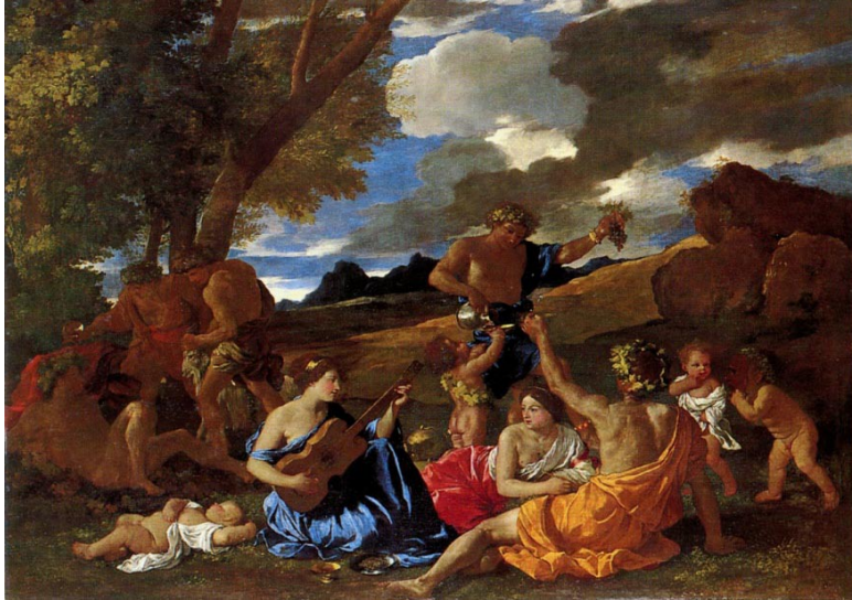
Poussin. Bacchanale à la joueuse de guitare . 121x175 cm. Musée du Louvre.

Quant aux ensembles continus qui assemblent des fragments, ils sont particulièrement bien représentés dans la Modernité. On les retrouve dans la plupart des manières innovantes de la fin du dix-neuvième siècle et du début du vingtième : dans l'impressionnisme et dans sa mouvance, dans le pointillisme, dans le fauvisme etc. Il n'est sans doute pas nécessaire d'en montrer des exemples.