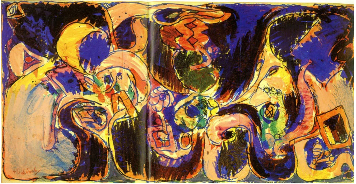
Alechinsky. Luxe, calme et volupté . 154x300 cm. Carnegie Museum of Art, Pittsburg.